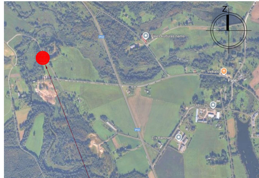
Pāles luterāņu baznīca